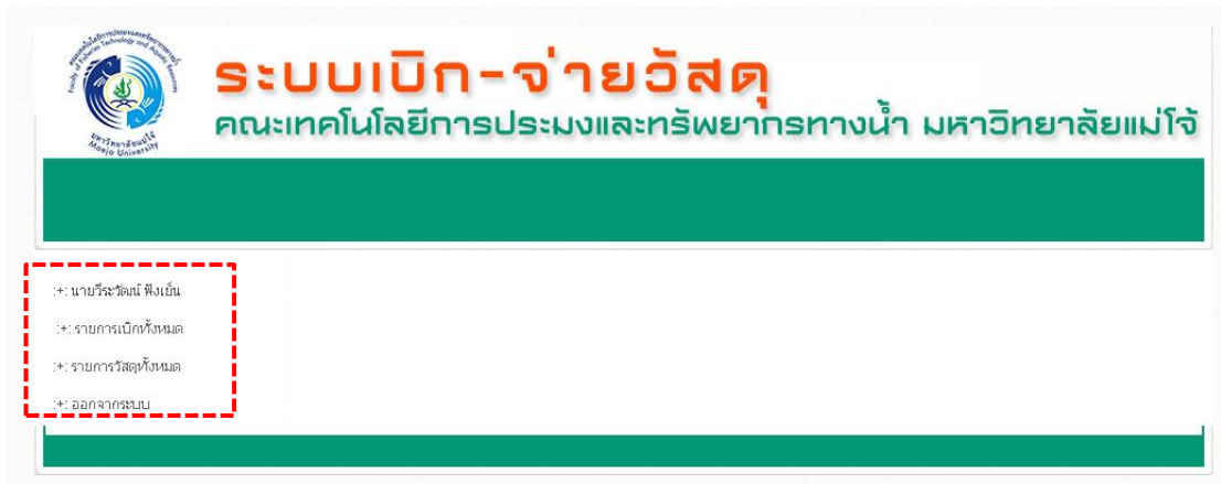
รูปภาพที่ 3