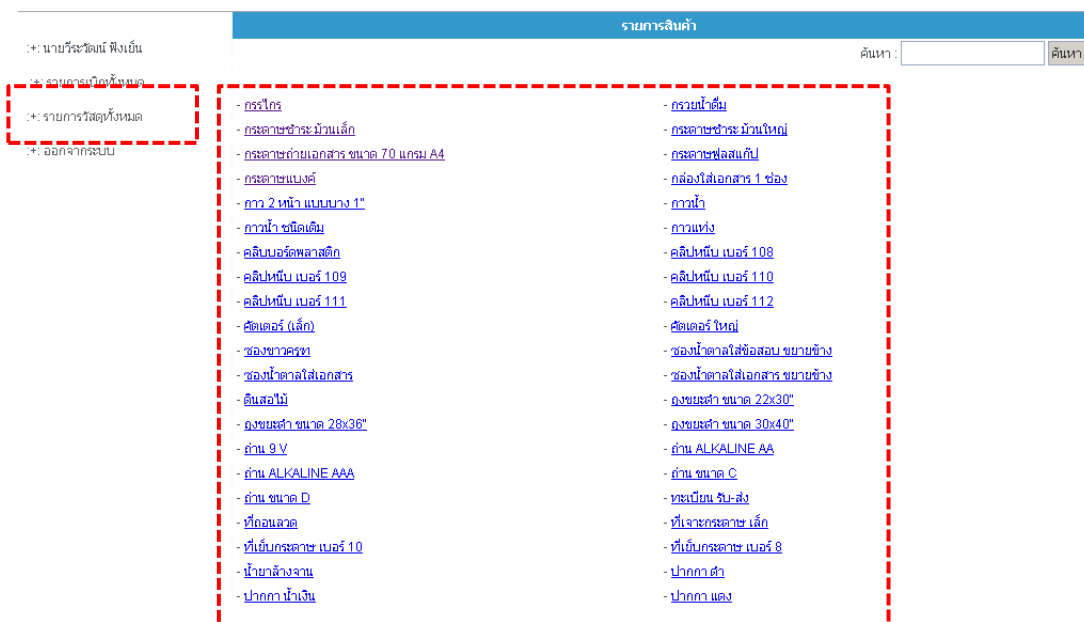
รูปภาพที่ 4